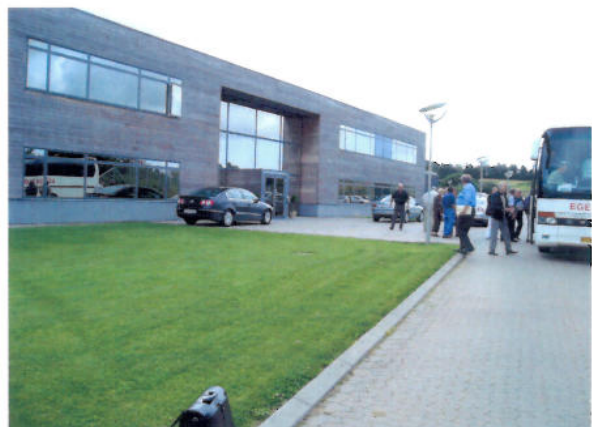
Vurderingsankenævnetsmedlemmer på kursus i vurdering af landbrug og erhvervsejendomme